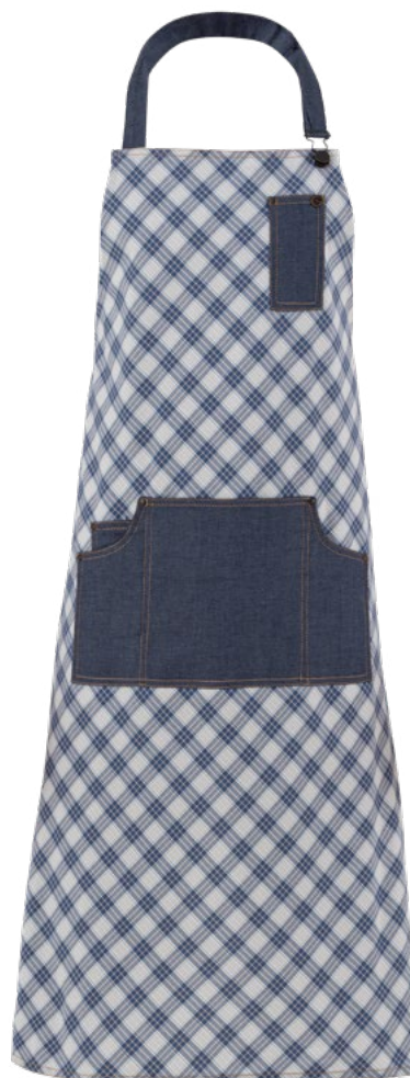
S118 Scozzese azzurro