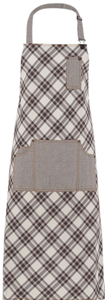
S322 Scozzese marrone

Il grembiule da lavoro con pettorina Douglas è ideale per locali moderni e per ambienti eclettici. È caratterizzato da un'ampia tasca centrale divisa in 3 scomparti, di cui due laterali più piccoli - in cui c'è anche un portapenne - e uno centrale più ampio. Douglas è proposto in diverse fantasie: rigato marrone, tortora, e fantasie scozzesi con tonalità di colore che vanno dal blu al marrone, tutte arricchite da impunture a due aghi in contrasto. I lacci del collo e della vita sono a contrasto e riprendono il colore del filato impunturato. Realizzato in tessuto policotone elasticizzato per coniugare eleganza e comodità, questo grembiule da sala è curato nei minimi dettagli. Un esempio? I rivetti in ottone invecchiato che incorniciano e conferiscono luminosità ad un capo dallo stile inconfondibile.