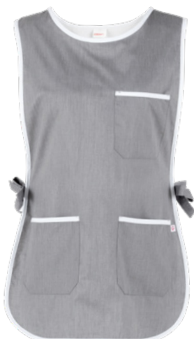
C02 Grigio chiaro