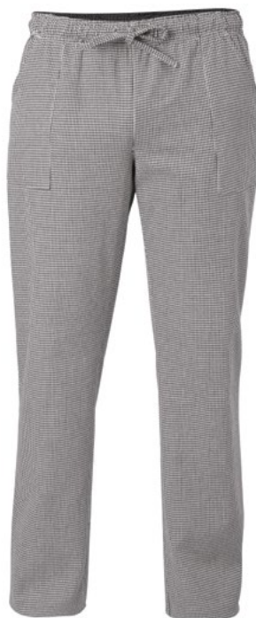
001 Sale e pepe

Il Pantalone Alan, evergreen della linea Giblor's, è realizzato in diversi tessuti e diverse varianti dalla linea unisex e vestibilità Slim Fit. Il taglio è decisamente classico: elastico alto e coulisse che cinge la vita, due tasche sui fianchi e piccola tasca posteriore.