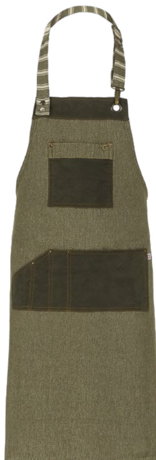
102 Verde militare