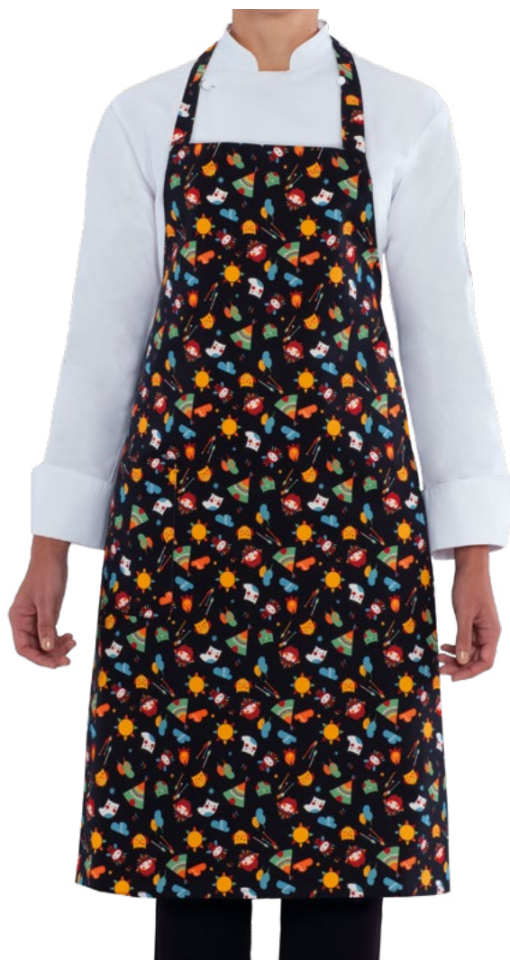
F013 Gufi indiani